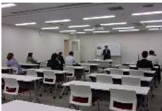
男性社員の研修希望者も多くみられました。

1回あたり10人程度の少人数で行い、ただ講師の話聞くというだけのものではなく、相互に会話や実践などを交え、マナーを身に付けていくスタイルで行っています。