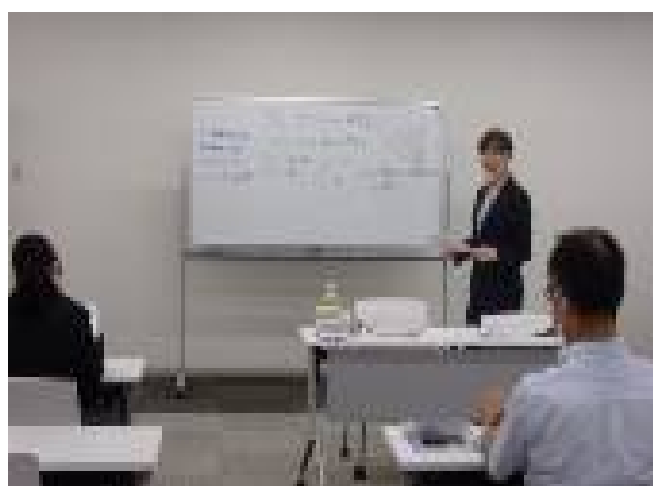
マナー研修といえど、堅苦しい雰囲気ではなくわきあいあい楽しみながら。