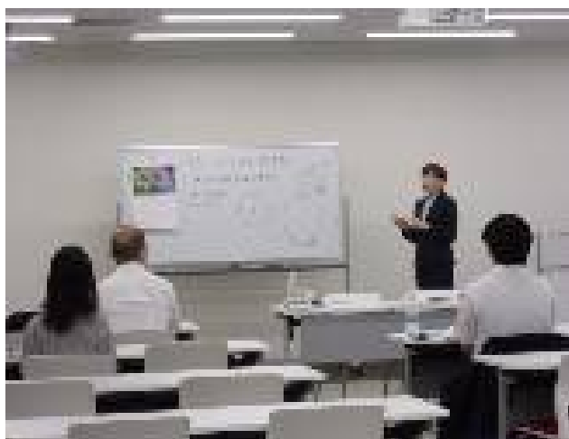
挨拶やお辞儀の重要性を習います。